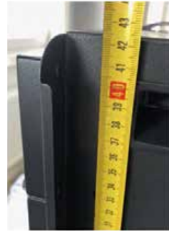
Высота – 42,5 см