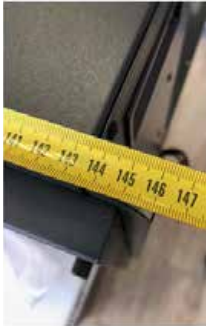
Ширина – 146 см (включая крепежные выступы).