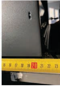
Глубина – 21,5 см (включая отверстие для кабеля).